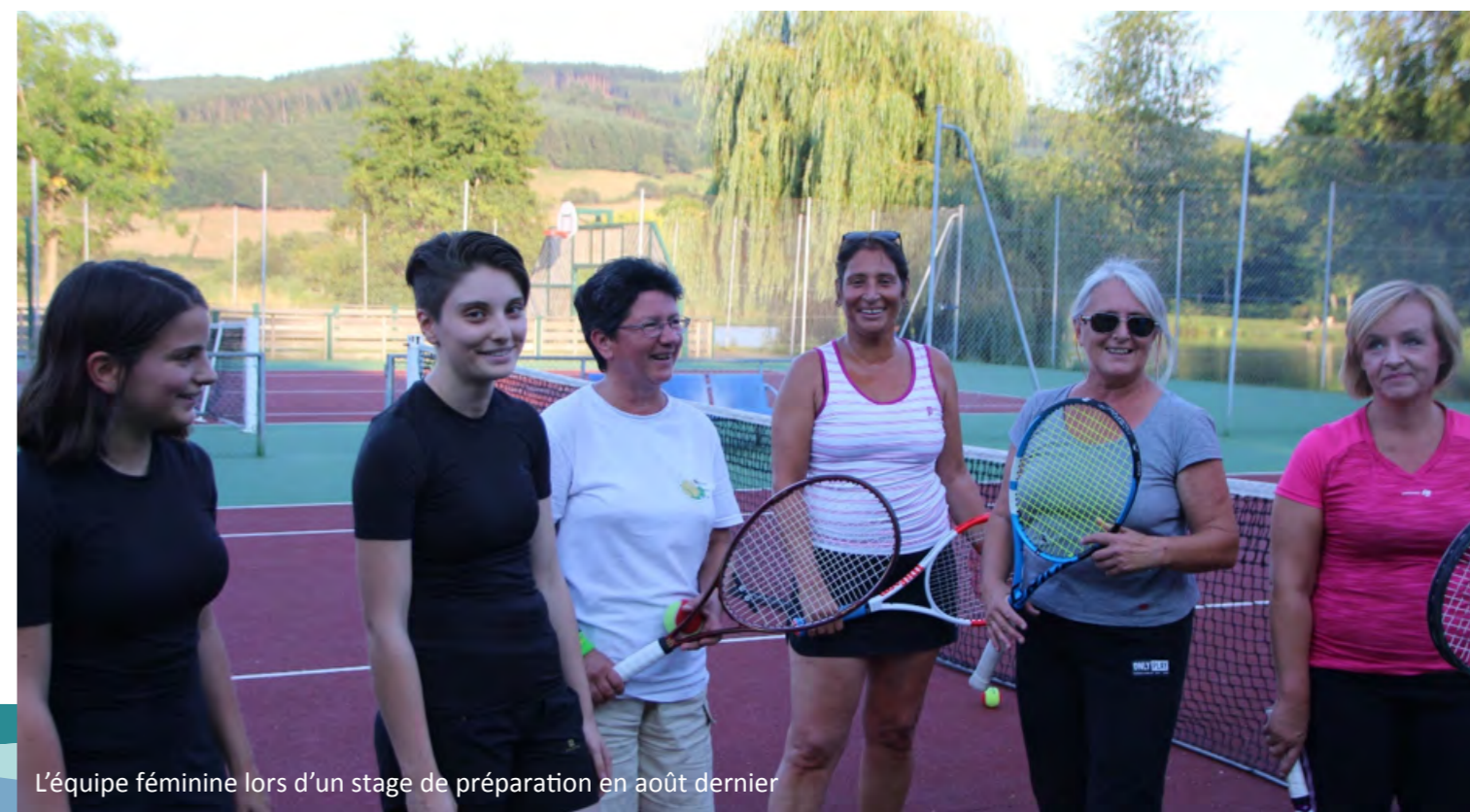
L'équipe féminine lors d'un stage de préparation en août dernier