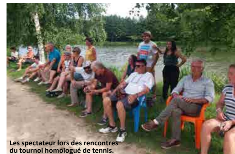
Les spectateurs lors des rencontres du tournoi homologué de tennis.