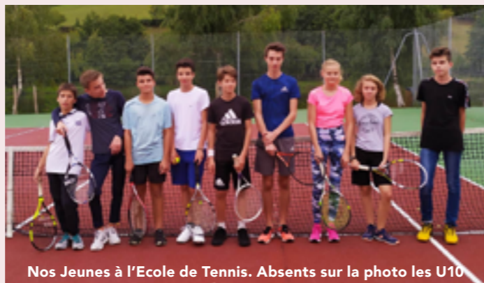
Nos Jeunes à l'Ecole de Tennis. Absents sur la photo les U10